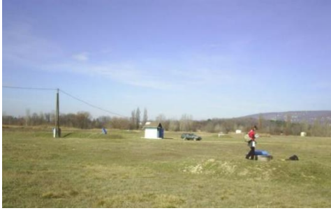
APENTA Ferenctelep egykor