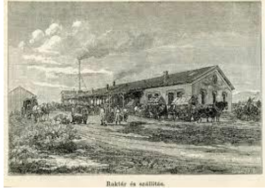
Keserűvíz utca, egykori sóbepárló