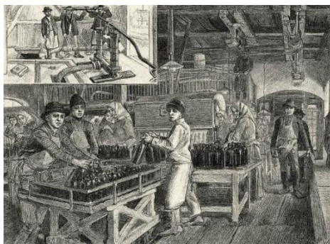
Gyógyvíz utca, San Lorenzo Kft

megtekintésével kezdtük. A film célja ugyan a Saxlehner család bemutatása, azonban az nem választható el a dél budai keserűvíz telepek – így az APENTA – történetétől sem. A film sok részletet bemutat a keserűvíz kitermelés, palackozás körülményeiről, az üzem működésének fénykoráról, majd elhalásáról.