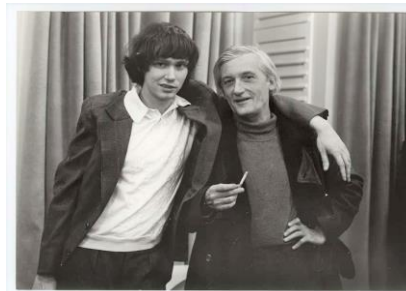
Pilinszky az ifjú Kocsis Zoltánnal