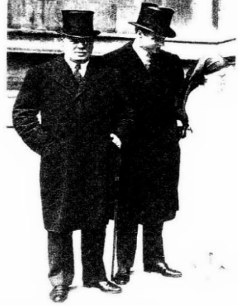
Lord Rothermere és fia

Június 21. Harold Sidney Harmsworth, Lord Rothermere legnagyobb napilapjában, a napi 1 millió példányban megjelenő Daily Mailben, 1927. június 21-én szombaton jelent meg a laptulajdonos „Magyarország helye a nap alatt” című cikke. A térképpel is illusztrált eszmefuttatásában a lord kiállt a trianoni békeszerződés revíziója mellett, s felajánlotta tollár és lapjait az ügy szolgálatában. A lord érvelésének két sarkterele volt. Egyrészt Angliának érdeke az európai béke megszilárdítása, amelynek elengedhetetlen feltétele a magyar területrevízió. Másrészt a nyugati országok kormányainak is támogatniuk kell a magyar rendszert, amelyre bizvást számíthatnak majd a bolsevizmus megerősödése idején. A cikk keletkezésében feltehetően ösztönző szerepe volt Hohenlohe Stefánia hercegnőnek, társasági nevén Steffi vagy Toffy princessnek, aki sokat forgolódott a lord környezetében. A brit hivatalos körök, amelyeket kényelmetlenül érintett a cikk okozta nyugtalanság a kisantant országainak fővárosaiban, kezdetől fogva egyértelműen és konzekvensen elhatárolták magukat és politikájukat a lord nézeteitől és személyétől. A magyar kormánykörök azonban nem vették figyelembe az angolok elutasító magatartását, ál-